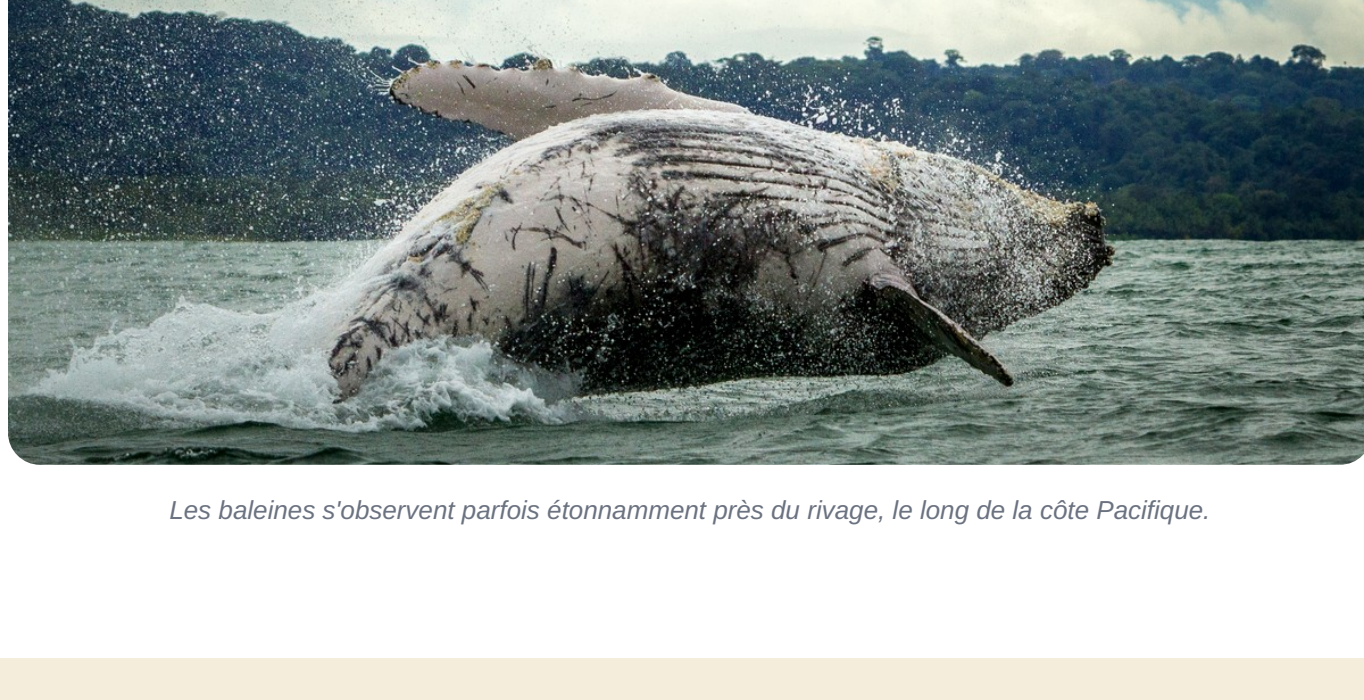
Les baleines s'observent parfois étonnamment près du rivage, le long de la côte Pacifique.

Une seconde fenêtre, plus discrète, accueille les baleines de l'hémisphère Nord de décembre à avril . Bonne nouvelle : juillet–octobre coïncide avec la saison verte, moins fréquentée — vous profitez du spectacle loin de la foule, et les averses tropicales ne durent que quelques heures.