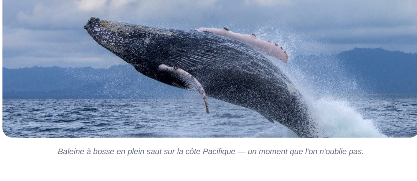
Baleine à bosse en plein saut sur la côte Pacifique — un moment que l'on n'oublie pas.

Surnommées ballenas jorobadas en espagnol, ces géantes peuvent atteindre 16 mètres et peser jusqu'à 40 tonnes. Et pourtant, rien ne prépare au premier souffle qui jaillit de l'eau, ni à ce saut spectaculaire — le breaching — qui retombe dans une gerbe d'écume. Au Panamá, ce spectacle se vit parfois à quelques centaines de mètres du rivage.