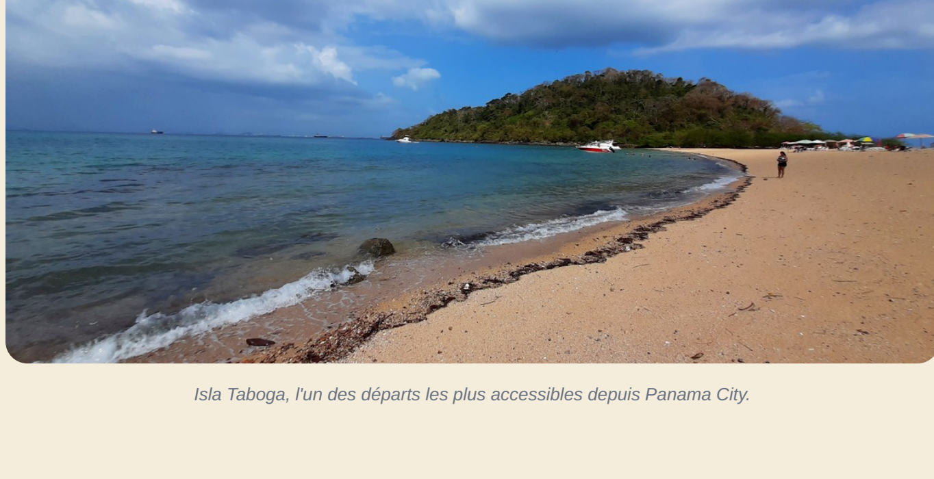
Isla Taboga, l'un des départs les plus accessibles depuis Panama City.

Un sanctuaire marin exceptionnel où l'on croise les baleines lors des sorties snorkeling et plongée.